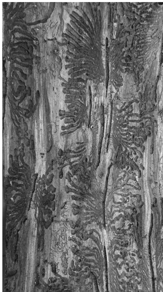
Figur 1 Bilden visar ett barkprov med gångsystem av granbarkborre

Barkprov insamlat från en gran dödad av granbarkborre. Barkproven tas på 4 meters höjd och analyseras sedan med avseende på granbarkborrens angreppstäthet och förökningsframgång samt förekomst av fiender och konkurrenter till granbarkborren. De horisontella gångarna är modergångarna längs vars sidor honorna lägger sina ägg. Ur äggen kläcks larver som gnager ut var sin larvgång.